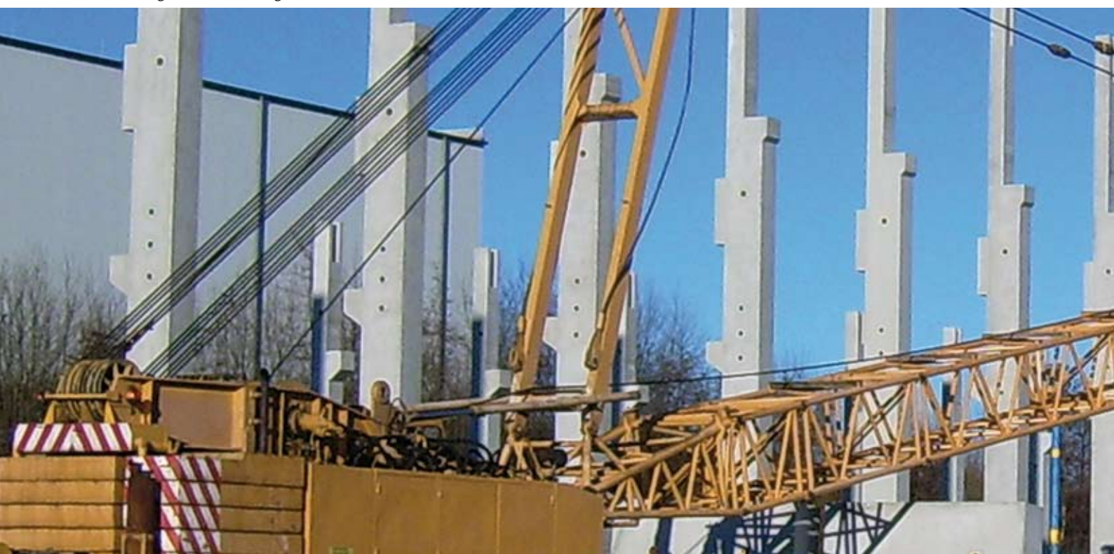
Stützenmontage einer 210 m langen Kranbahnhalle