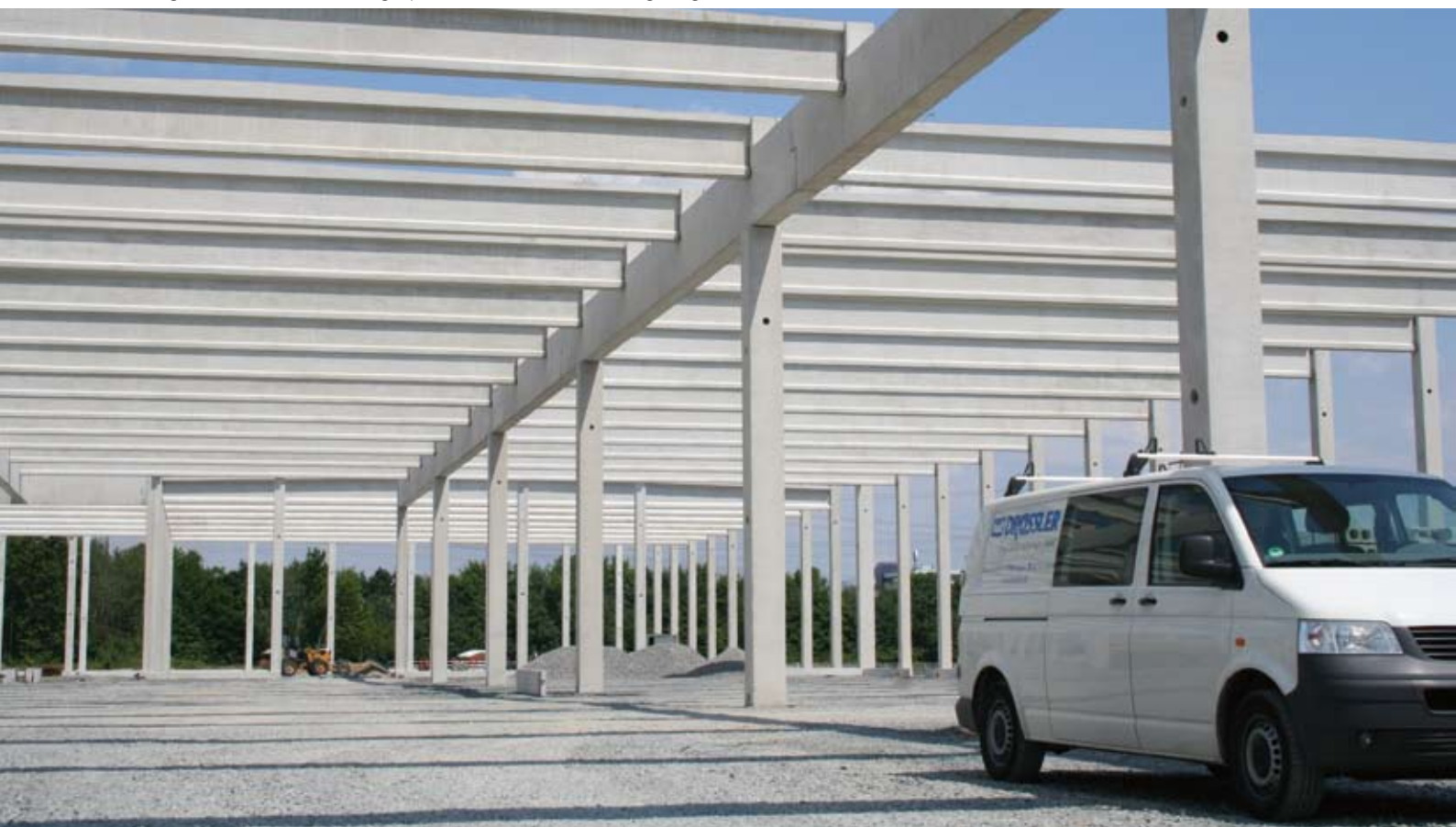
Betonfertigteilkonstruktion mit vorgespannten Bindern und Abfangeträgern