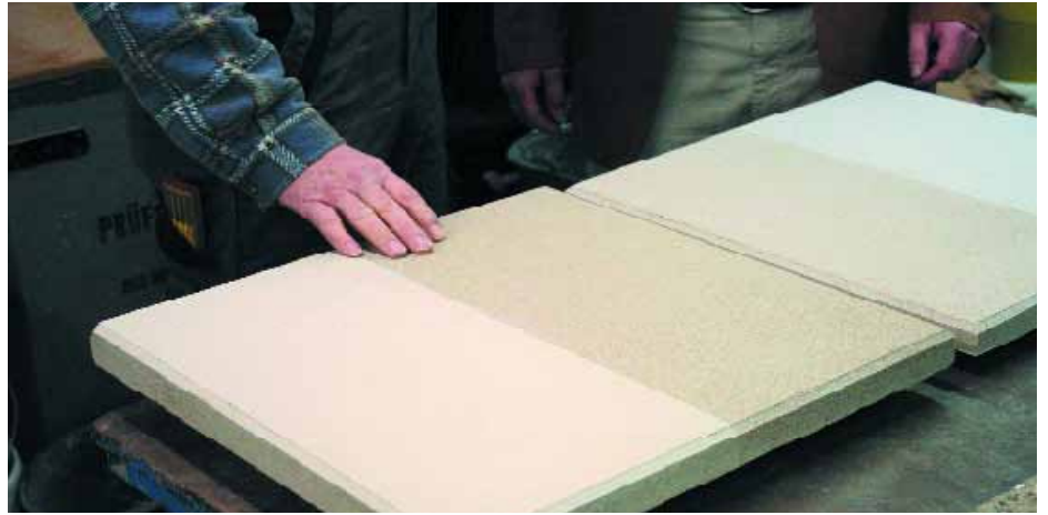
Optische und haptische Prüfung verschiedener Farben und Oberflächen eines Fassadenelements