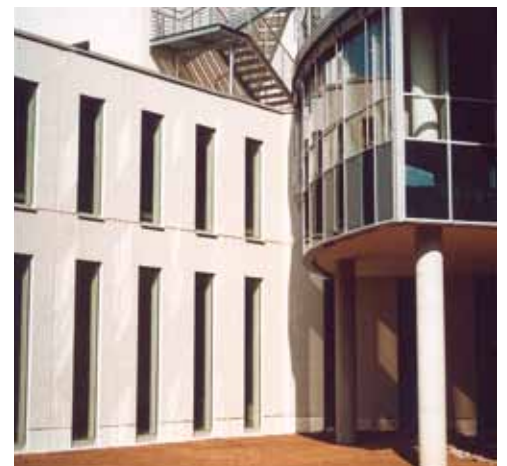
Detail der Carrara-Sandwichfassade und Rundstütze aus unserem selbstverdichtenden Beton easyflow