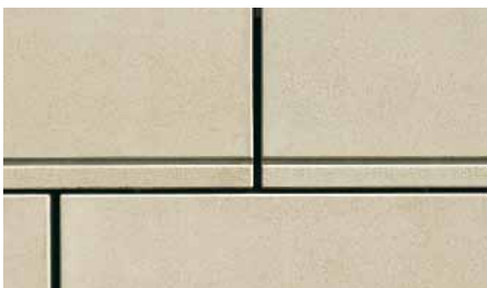
Stoß- und Scheinfugen