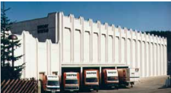
Auslieferungslager der Sieper-Werke, Hilchenbach