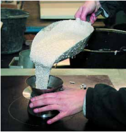
Zubereitung einer individuellen Mischung zur Herstellung einer Musterplatte