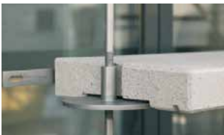
Detail eines Lamellen-Auflagers