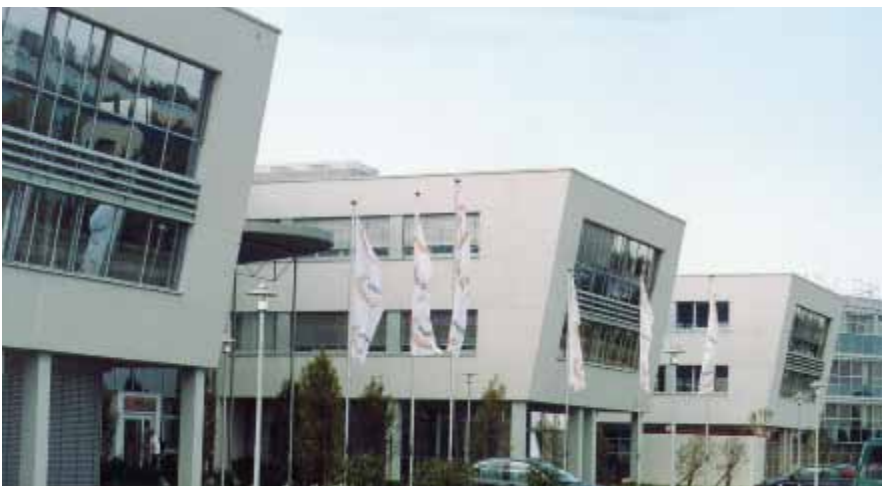
Verwaltungsgebäude Europazentrale Visteon, Kerpen, Carrara-Waschbeton