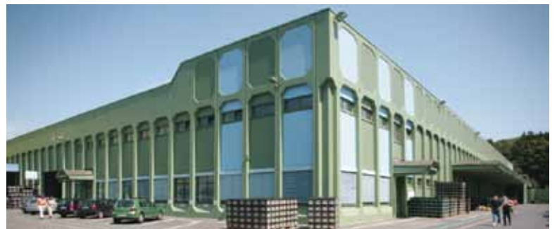
Flaschenabfüllanlage der Krombacher Brauerei, Krombach