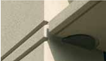
Laibungsdetail: Umecke mit Lamellenaufleger

Auch unser wärmedämmendes Sandwich-Element bietet als Komplett-Fassade mit individuellen Gestaltungsmöglichkeiten viel Spielraum für Ihre Kreativität.