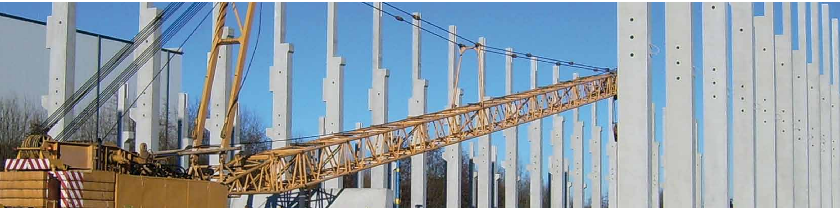
Stützenmontage einer 210 m langen Kranbahnhalle