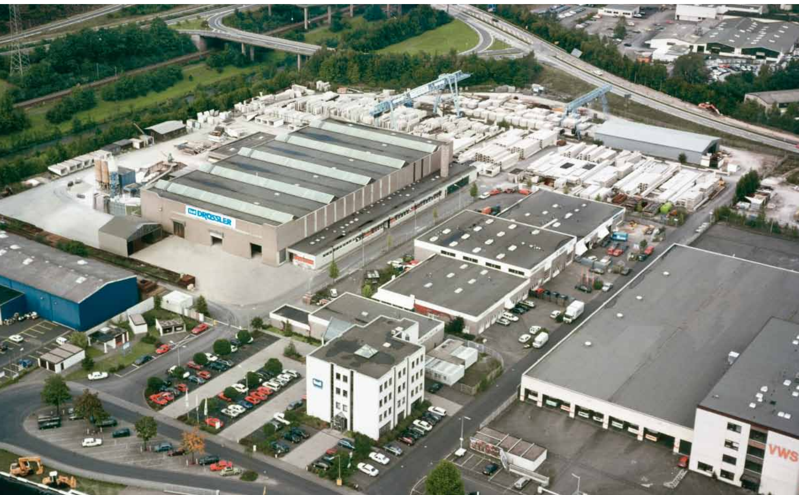
Unser Standort in Siegen, Marienhütte