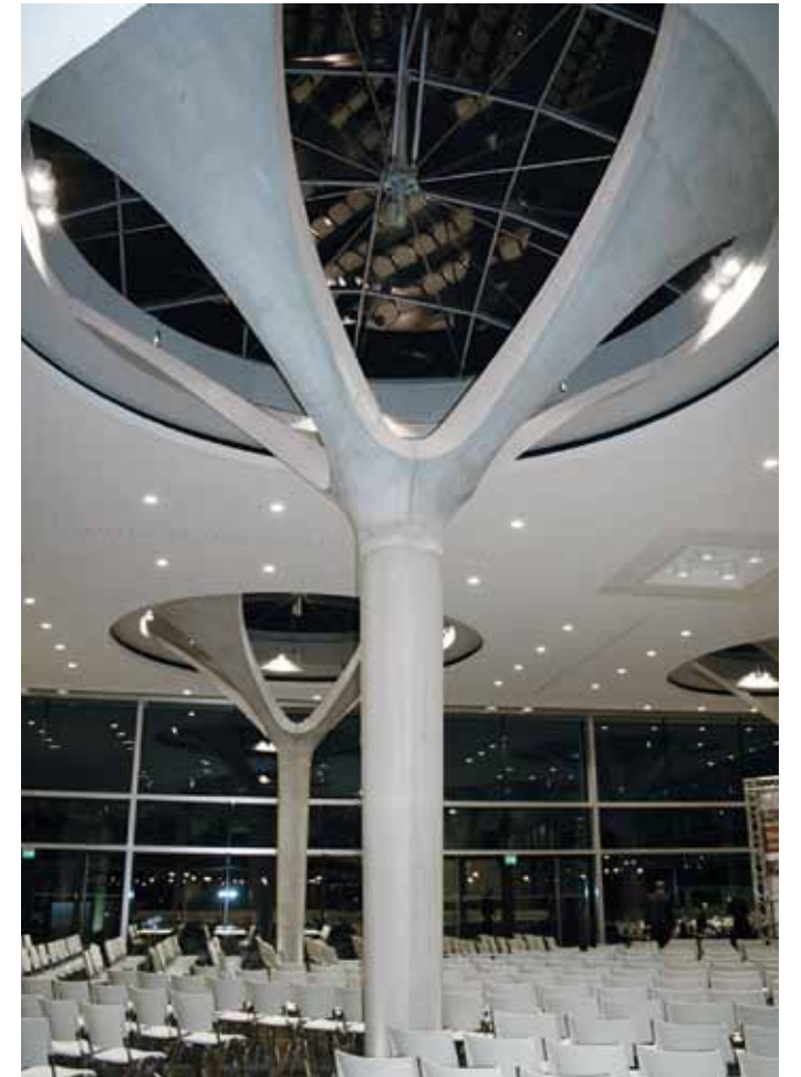
Dreidimensional geformte Sonderarchitektur-Elemente Mitarbeiter-Restaurant Boehringer Ingelheim