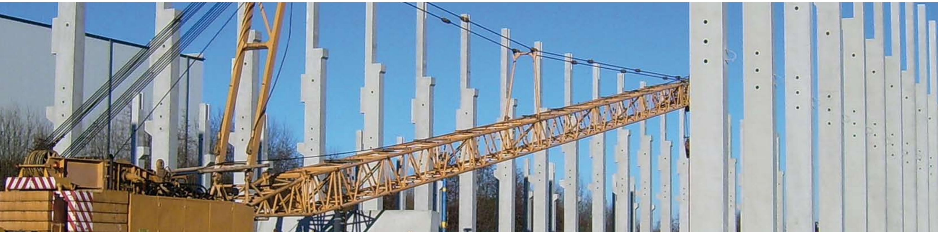
Stützenmontage einer 210 m langen Kranbahnhalle