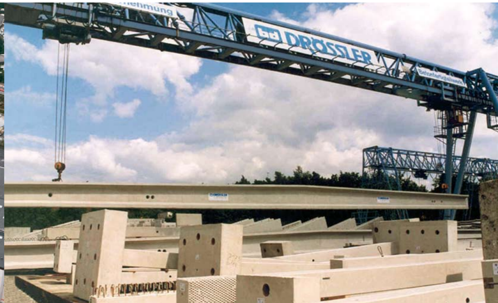
Blick auf unser Außenlager

Unsere Forschung und Entwicklung rund um das Bauen mit Beton in permanenter Zusammenarbeit mit Hochschulen ist richtungsweisend und hat uns ein hohes Maß an Anerkennung gebracht.