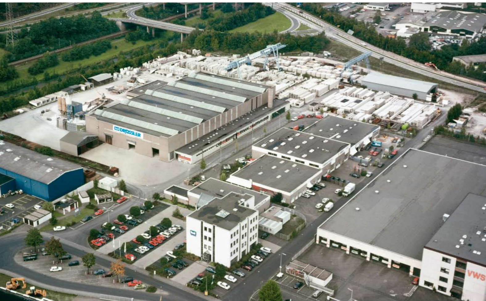
Unser Standort in Siegen, Marienhütte

Frühzeitig haben wir das Arbeiten mit Betonfertigteilen als effiziente Baumethode erkannt und bereits 1962 unser erstes Spannbeton-Fertigteilwerk in Siegen in Betrieb genommen. Doch Tradition verpflichtet auch für die Zukunft: