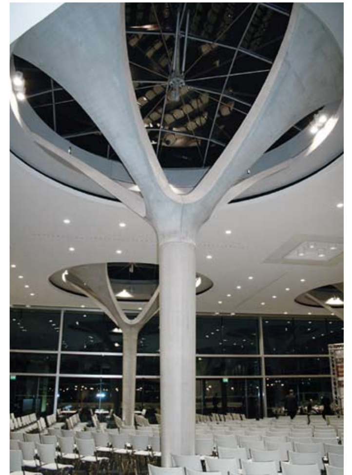
Dreidimensional geformte Sonderarchitektur-Elemente Mitarbeiter-Restaurant Boehringer Ingelheim